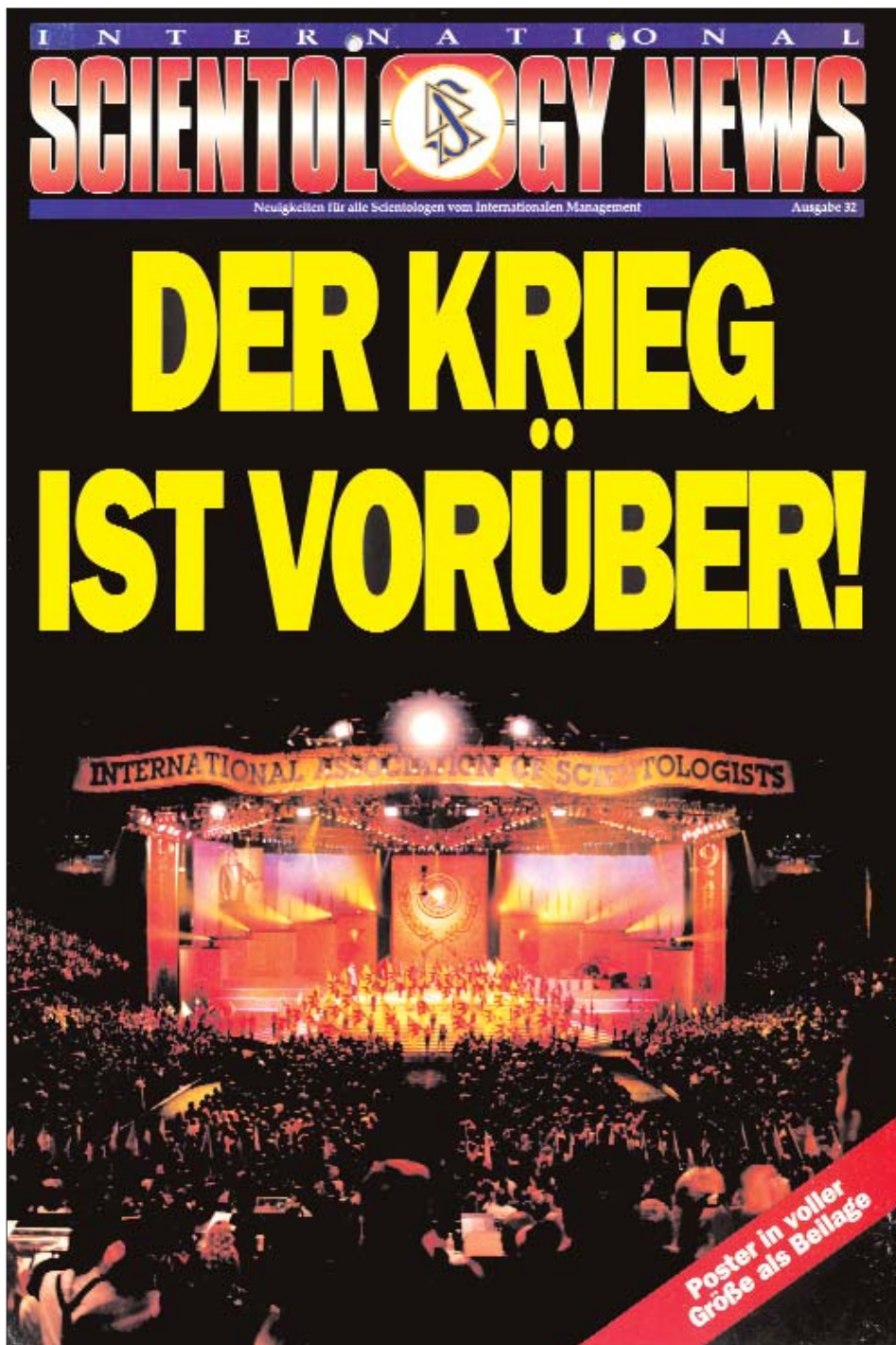
Titelblatt der „International Scientology News“ Nr. 32 zur Vereinbarung mit dem IRS im Jahr 1993.

brauchte eine Menge Arbeit. Es endete mit einem Friedensvertrag. Ich habe Ihnen davon eine Kopie mitgebracht, um es Ihnen zeigen zu können. Dies zeigt, was es heißt, jeglichen außergewöhnlichen Konflikt mit dem IRS zu lösen. Dies zeigt, wie groß dieser Krieg war. Ich möchte, dass Sie noch etwas anderes verstehen. Die Macht unserer Gruppe ist größer, als Sie sich vorstellen können. Wenn wir Schulter an Schulter stehen, gibt es nichts, was wir nicht erreichen können.“